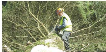
Irlannissa tarvitaan myös ammattitaitoisia metsureita. Puut ovat usein todella oksaisia ja tuulenkaatoja on paljon.