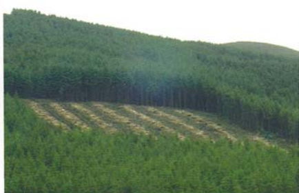
Irlannissa hakkuut tapahtuvat usein jyrkissä rinteissä, mikä asettaa työskentelylle omat erityisvaatimuksensa.

Coillte omistaa metsämaita noin 440 000 hehtaaria joka on 7 % maan pinta-alasta. Yksityis metsämaan omistajien osuus 2 - 3 %, metsiä on Irlannin pinta-alasta kokonaan noin 10 %.