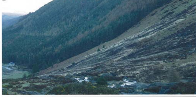
Irlannissa luonto ja maisemat ovat kauniit mutta ilmasto usein karu. Korjuolosuhteet vaihtelevat suuresti mutta ovat pääsääntöisesti erittäin haastavia. Kuvan rinteessä odottaa hakkuuta noin 20 000 m 3 leimikko.