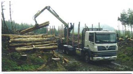
Puu kulkee tienvarresta sahalle ja sellutehtaille puutavara-autoilla. Irlannissa suurin sallittu kokonaispaino yleisillä teillä on 40 tn ja kuljetusmatka kestää 1-6 tuntia.

Hakkuoikeuksista jätetään 2 viikon välein tarjoukset joista kilpailu on kovaa ja vaatii yrittäjältä osaamista. Koneyrittäjän kannalta sahan ostotarjous on parempi kun puu liikkuu suoraan sahalle. Tienvarsiakassa puu ei lähde nopeasti sahalle ja