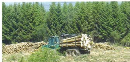
Longford Timber Ltd. on Irlannin suurin metsäkoneyritys jolla on 26 ct-metsäkoneita sekä viitisentoista puutavara-autoa.

Coillten vuotuinen hakkuumäärä on noin 2,7 milj. m 3 josta kuitupuun osuus noin 27%. Lisäksi hakataan noin 200 000 m 3 yksityismetsistä.