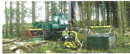
Sakari varusteli käyttöönsä huoltotankin josta löytyi kaikki tarpeellinen koneen pitämiseksi iskussa ja tuottavassa työssä ilman turhia ajeluja.