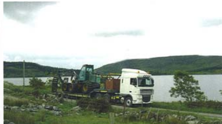
Metsäkoneet kulkevat hakkuualueelta toiselle kuljetusautoilla. Siirtomatkat ovat usein hyvin pitkiä rannikolta toiselle.

- Sain näin toimimalla keskittyä pää toimeen eli puun kaatoon. Toimenpiteillä on iso merkitys tuotoksen ylläpitämiseen, ei mene sormi suuhun kesken leimikon jos ajokoneita alkaa ilmestyä samalle tontille vaan rokkia kankaalle!