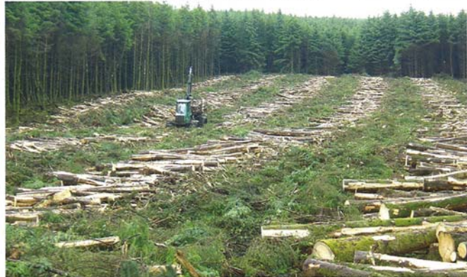
Irlannissa päättehakuun ikä on noin 40 vuotta ja avohakkuutyömaiden keskikoko on noin 2 000 m 2 - 10 000 m 2 ja järeys 0.300 l - 0.800 l. Valtio myy hakuuolkeuden leimikoihin kahden viikon ajan.

- Ajattelin että tekisi hyvää päästä ajamaan koneilla jos tulevaisuudessa luo uraa käyttökouluttajana. Siinä oppii lisää